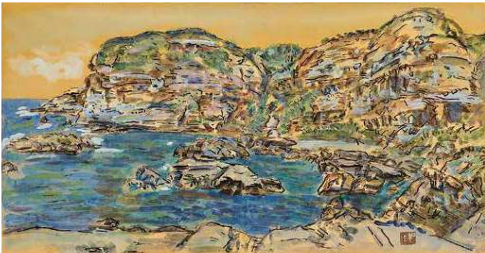
「下府海岸」小林 和作