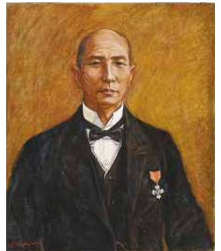
「佐々木準三郎肖像」森脇 忠