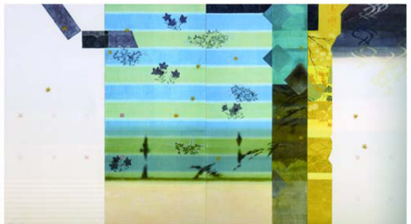
▲「あ伎の野辺」北田克己